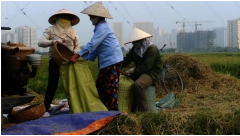
Hình minh họa

Sản xuất nông nghiệp quy mô nhỏ là một trong những yếu tố cốt lõi trong việc xóa đói giảm nghèo, cùng với tạo việc làm và giữ gìn hệ sinh thái ở các nước đang phát triển. Bên cạnh đó, nó còn là nguồn cung quan trọng trong chuỗi cung ứng toàn cầu.