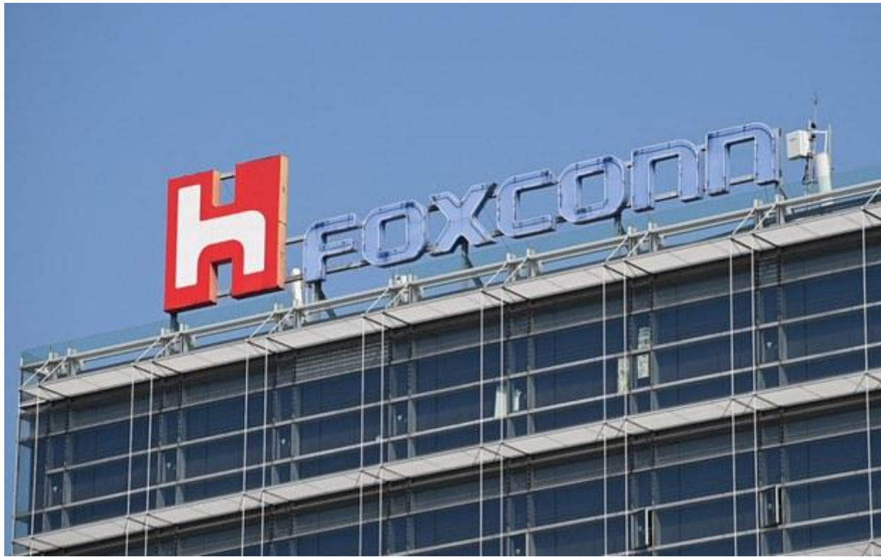
Logo của Foxconn trên tòa nhà của hãng ở Đài Bắc (minh họa).

Thiếu điện đã khiến Chính phủ Việt Nam phải kêu gọi nhà máy của các tập đoàn nước ngoài phải ngừng sản xuất nhiều ngày, trong đó có Foxconn – hãng chuyên sản xuất cho Apple.